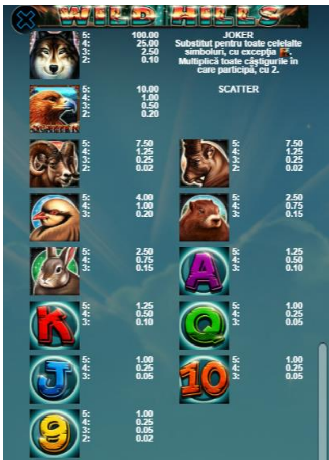
Fig. 2 Tabelul câștigurilor