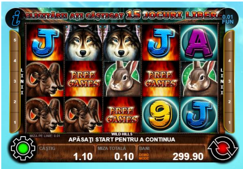
Fig. 3 Ecran-exemplu de joc gratuit