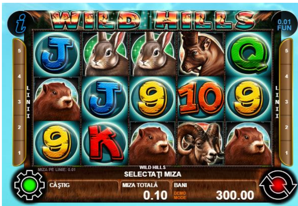
Fig. 1 Ecranul jocului principal

* setat în prealabil în setările jocului