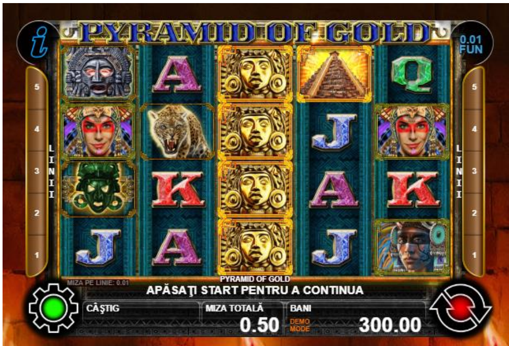
Fig. 1 Ecran al jocului principal