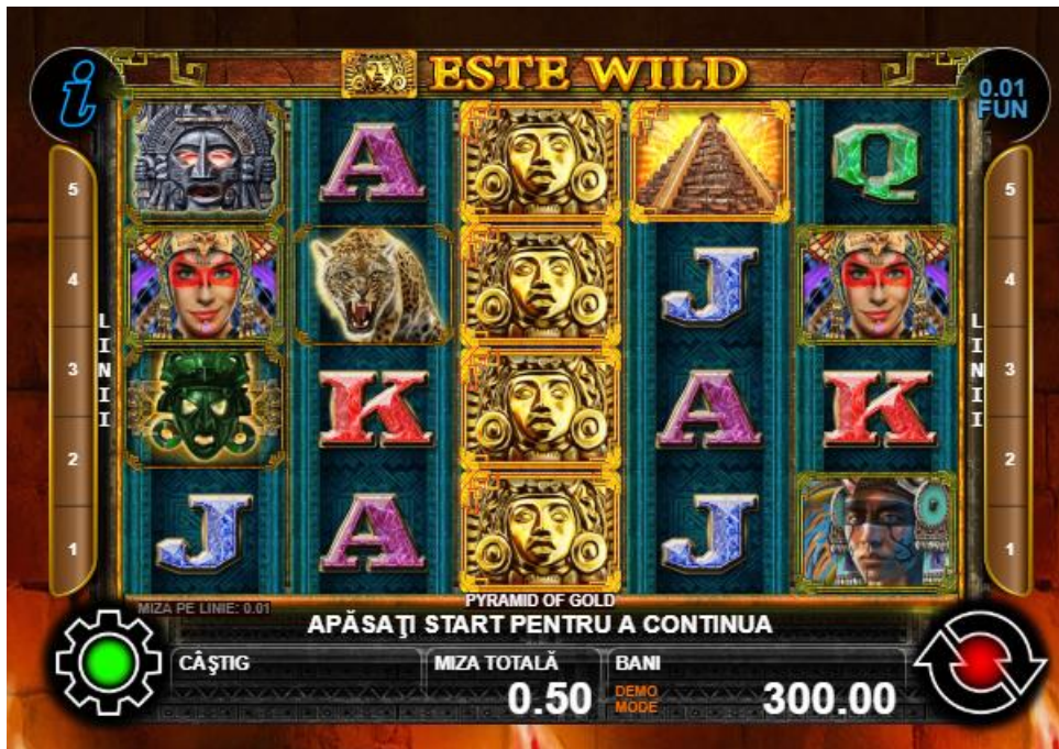
Fig. 3 Ecran joc gratuit