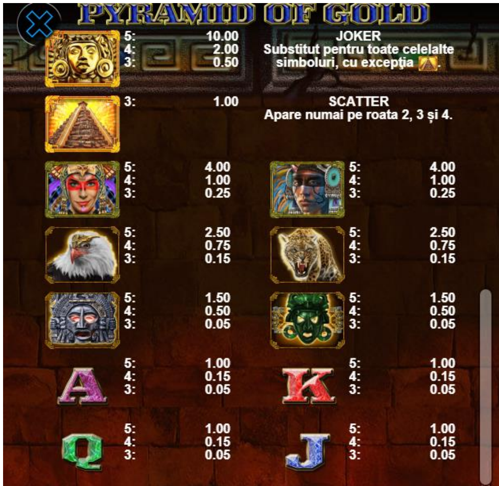
Fig. 2 Tabelul câștigurilor