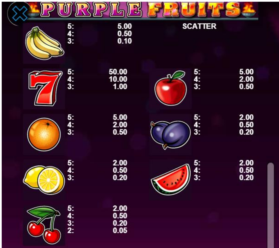
Fig. 2 Tabelul câștigurilor