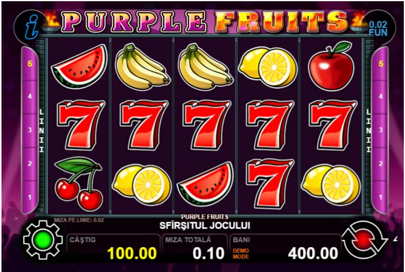
Fig.3 Combinație câștigătoare cu participarea unui scatter