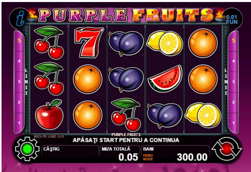
Fig. 1 Ecranul jocului principal

* setat în prealabil în setările jocului