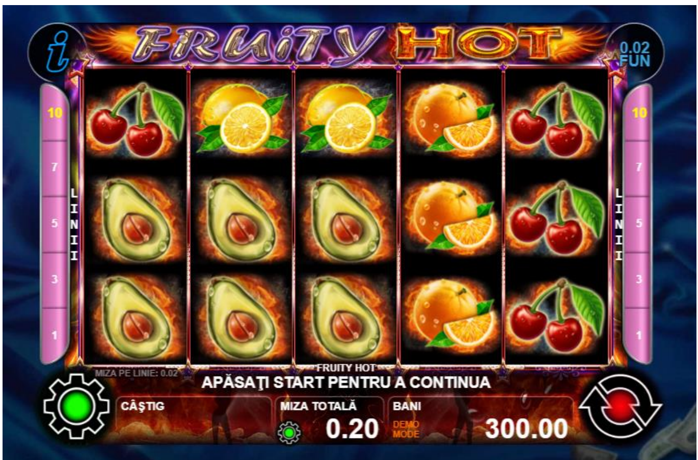
Fig.1 Ecranul jocului principal