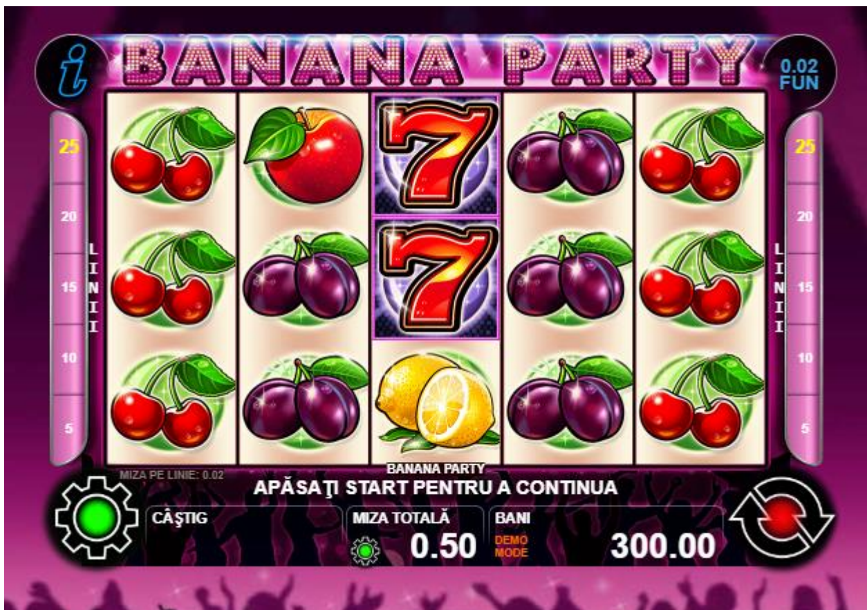
Fig. 1 Ecranul jocului principal

* setat în prealabil în setările jocului