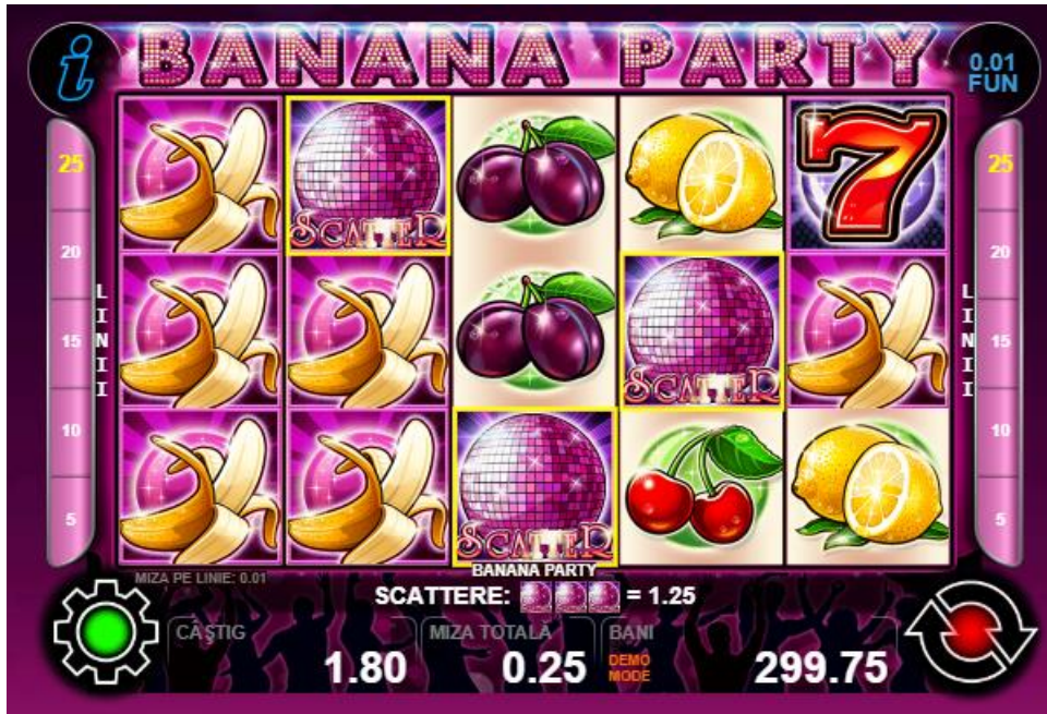
Fig. 3 Ecranul cu combinația câștigătoare cu participarea simbolului scatter