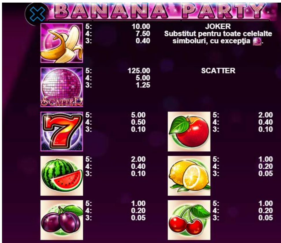
Fig. 2 Tabelul câștigurilor