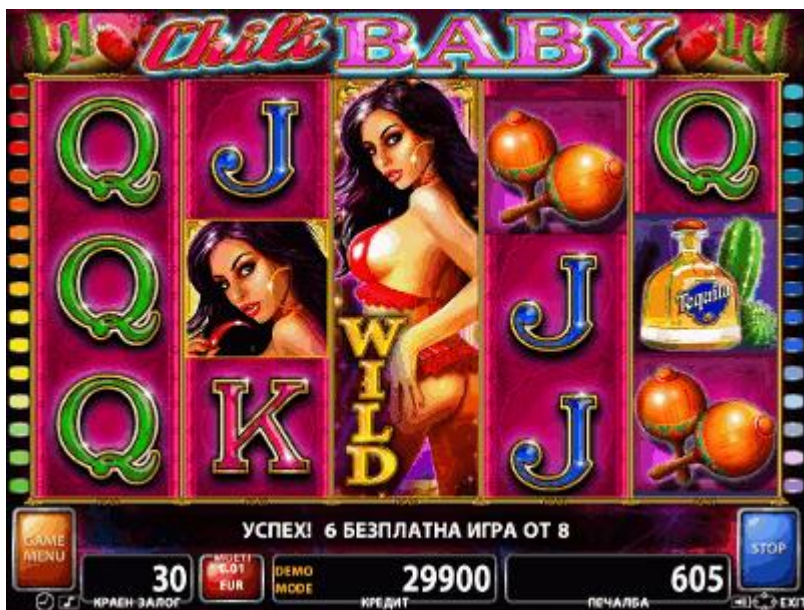
Fig. 3 Ecranul jocului gratuit