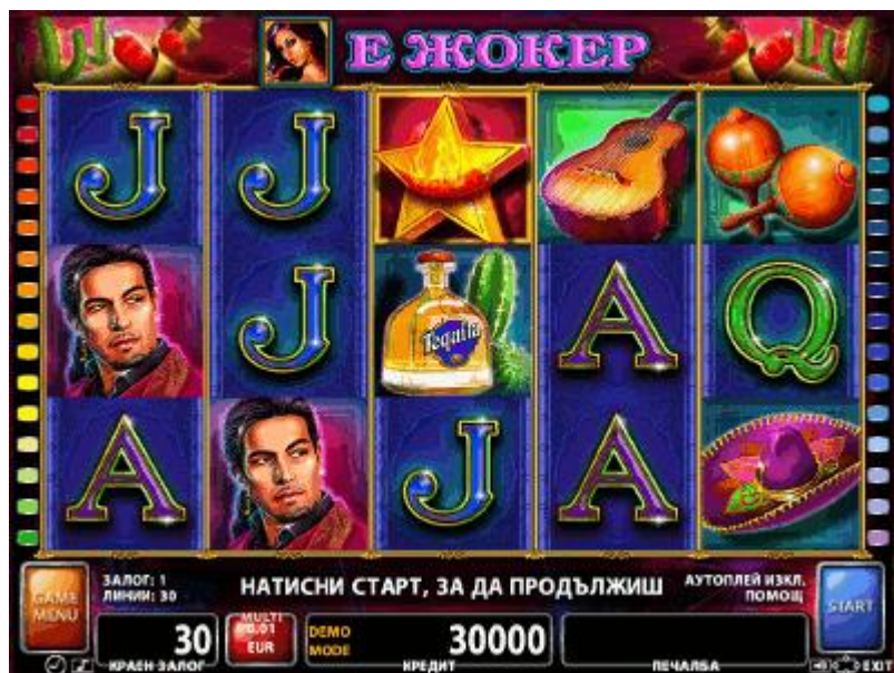
Fig. 2 Ecranul jocului principal